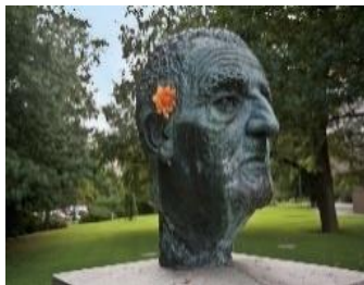
Bruckner@Linz Tourismus Erich Goldmann

Montag, 09. September – Samstag, 14. September 2024